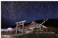
本村 芳文 (白山)

富山の立山、石川の白山、静岡の富士山は日本三霊山と称され、数ある霊山の中でも特に山岳信仰が盛んです。当館には御岳を展望できる休憩室、御岳資料コーナーがあり、「自然・祈り・美術」を運営の基本としています。写真、版画、ガラスなど、多様な技法で活動している作家の新作、新作をはじめ、当館が所蔵する三霊山に関する作品を展示する展覧会を開催します。三霊山の魅力を立山・御岳を望む上市町でお楽しみください。