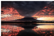
橋向 真 (富士山)