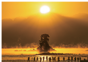
イナガキヤスト (立山)